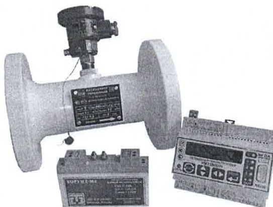
Рисунок 2 – Общий вид счетчика в комплекте с ПР

Место установки пломбы показано на рисунке 3.